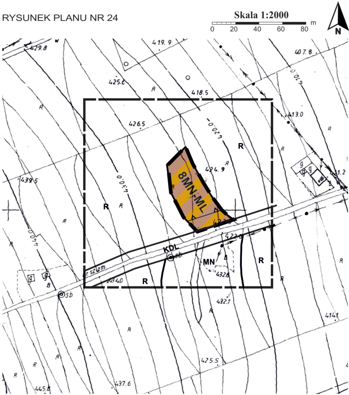
RYSUNEK PLANU NR 24

Układ współrzędnych mapy ETRS89/POLAND CS 2000 ZONE 7 ID EPSG: 2178